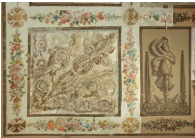
Ил. 6. Угол плафона в процессе расчистки живописи от записей Fig. 6. Corner of the plafond during the over-paintings removal

Fig. 5. The royal monogram, crowned A II, and a hammer and sickle with the inscription USSR 1917 painted over the letters