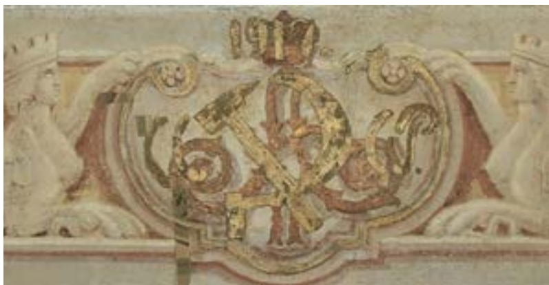
Ил. 5. Царская монограмма «А II» с венчающей короной и нанесенный поверх литер серп и молот с надписями «СССР 1917 г.»

Fig. 7. Cross-section of a sample from the figurative and ornamental composition background Stratigraphy of layers: 1. Plaster coat; 2. Gluing layer; 3. Ground layer; 4. Blue colored layer (original background); 5–9. Layers of later overpainting