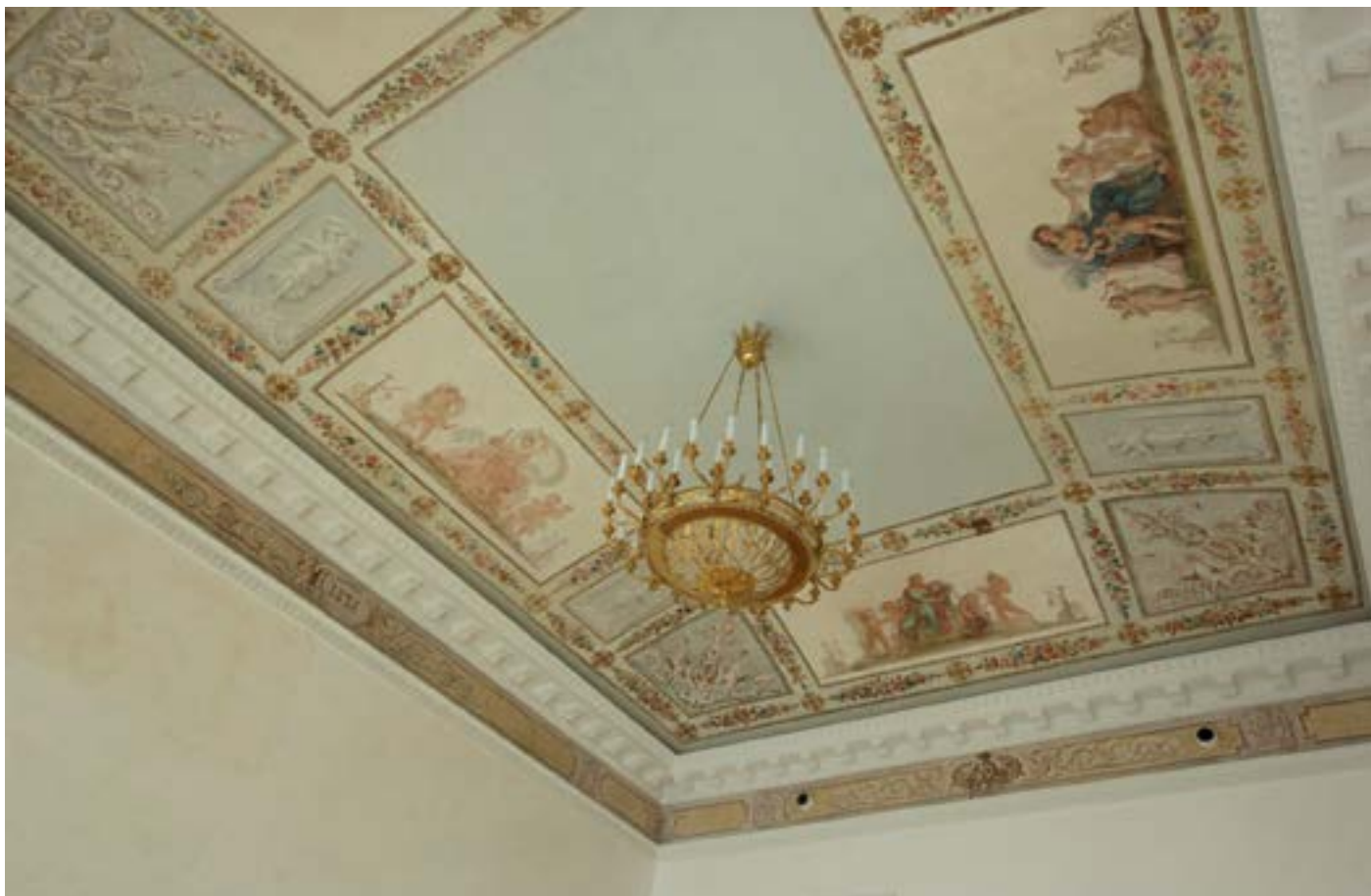
Ил. 8. Общий вид плафона после реставрации Fig. 8. General view of the plafond before the restoration