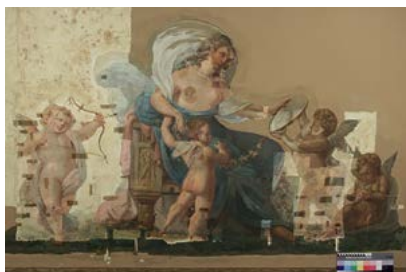
Ил. 2. Фрагмент композиции «Венера перед зеркалом». В процессе расчисток Fig. 2. Venus in front of the mirror , detail of the plafond. During the cleaning process