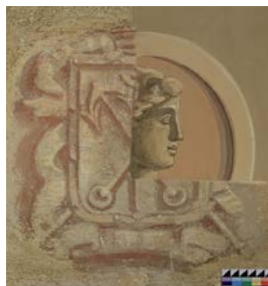
Ил. 4. Обнаруженный в процессе расчисток герб Санкт-Петербурга Fig. 4. The coat of arms of St. Petersburg discovered during the clearing process

Реставрация дома И.О. Сухозанета позволила вернуть в оборот петербургской культуры уникальный памятник архитектуры (Ил. 9). Выполненная работа — это лишь начало открытия живописи художника Антонио Виги в доме И.О. Сухозанета и возвращения его наследия широкому кругу зрителей.