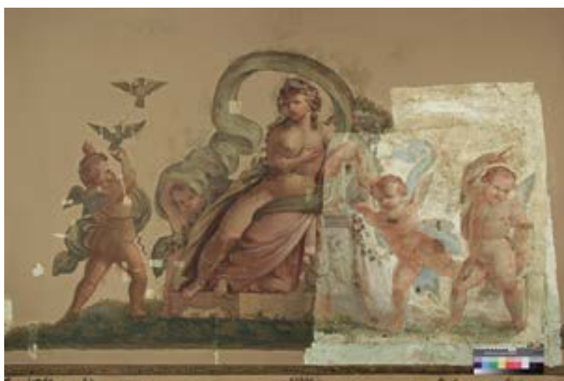
Ил. 3. Композиция «Аврора». Общий вид в процессе удаления поздних записей пожелтевшей клеевой пленки Fig. 3. Aurora , detail of the plafond. During the over-paintings and adhesive layers removal

записей темперы ПВА, промежуточных укреплений расчищенных красочных слоев, тонирования и воссоздания утрат красочного слоя.