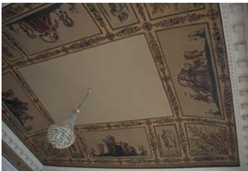
Ил. 1. Красная гостиная до реставрации Fig. 1. Red living room before the restoration