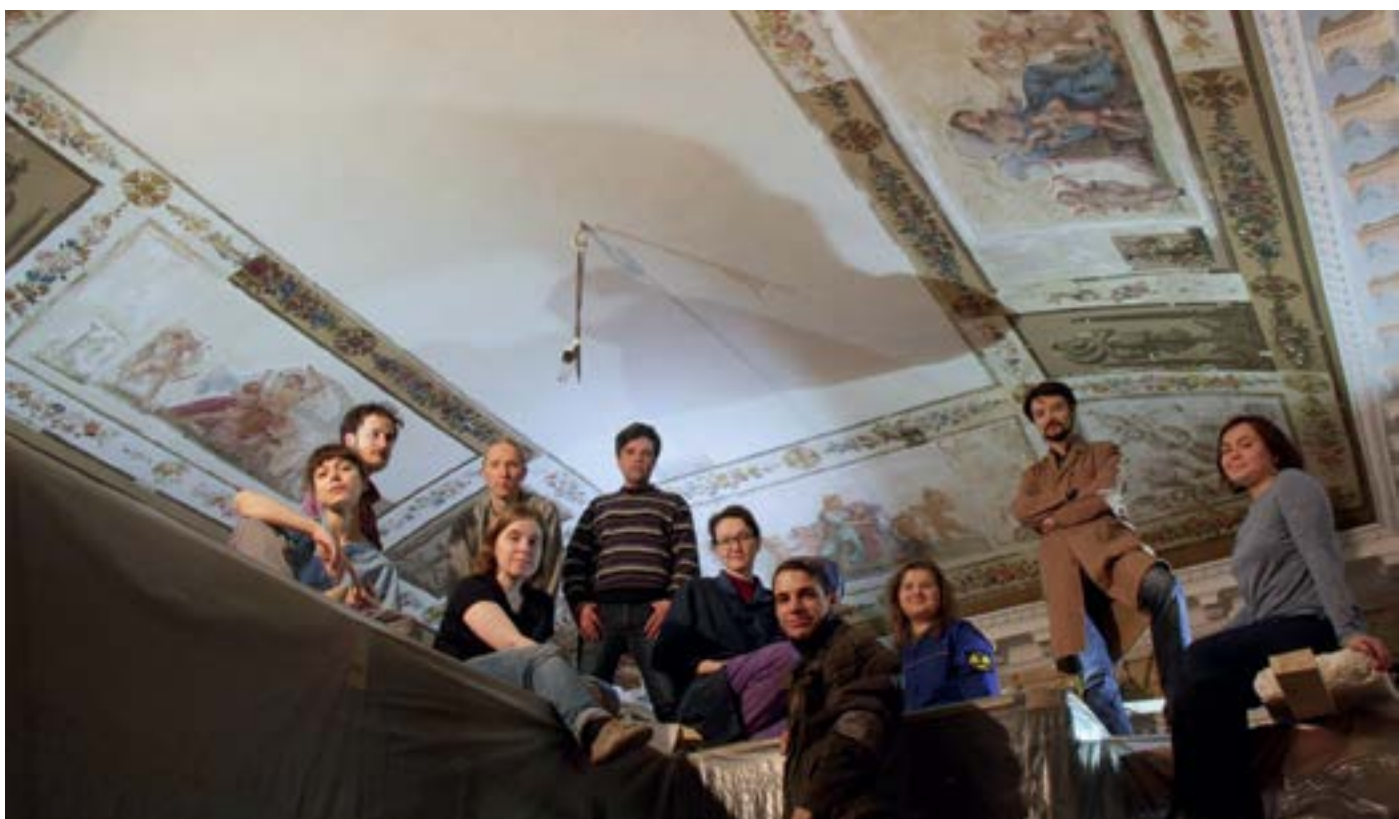
Ил. 9. Реставраторы академии А.Л. Штиглица Fig. 9. Restorers of the Stieglitz Academy